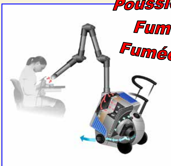
Peut être équipé de 1 ou 2 bras ALSIDENT SYSTEM® 50 ou 75